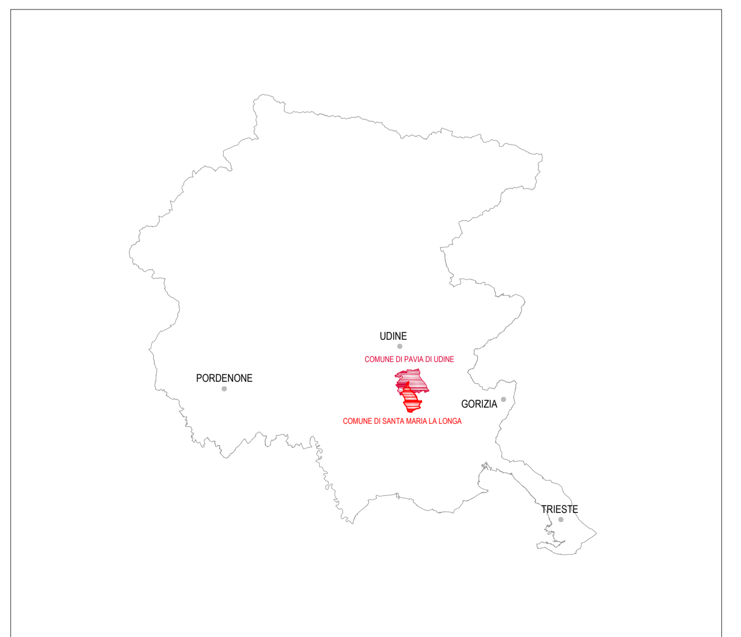
INQUADRAMENTO GENERALE Scala 1:100.000